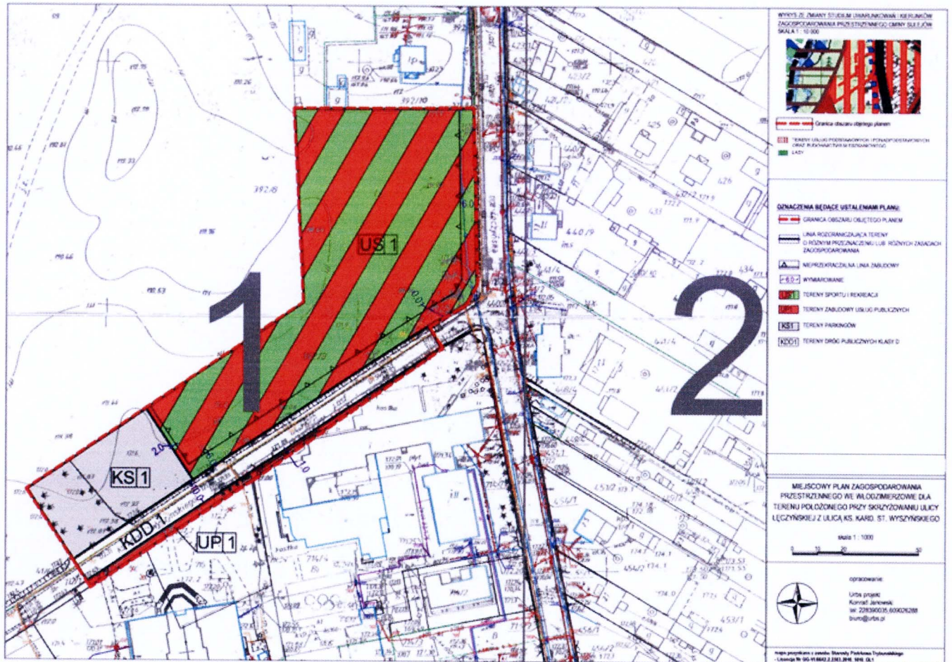
Rysunek planu w skali 1:1000

Załącznik Nr 1 do uchwały Nr LX/508/2018 Rady Miejskiej w Sulejowie z dnia 24 września 2018 r.